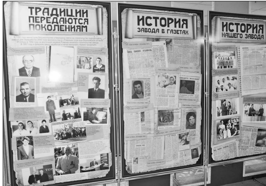
Выставка, посвящённая юбилею завода, в Ровеньском ЦКР.

вдвое увеличит объёмы переработки молока, которые достигнут 400 тонн в сутки. Несложно подсчитать, какое по количеству поголовье дойного стада надо иметь поставщикам, чтобы обеспечить эти объёмы: при среднесуточных надоях 15 килограммов в сутки от коровы – около 27 тысяч голов. Для сравнения - в нашем районе на сегодня содержится примерно четверть от этого количества.