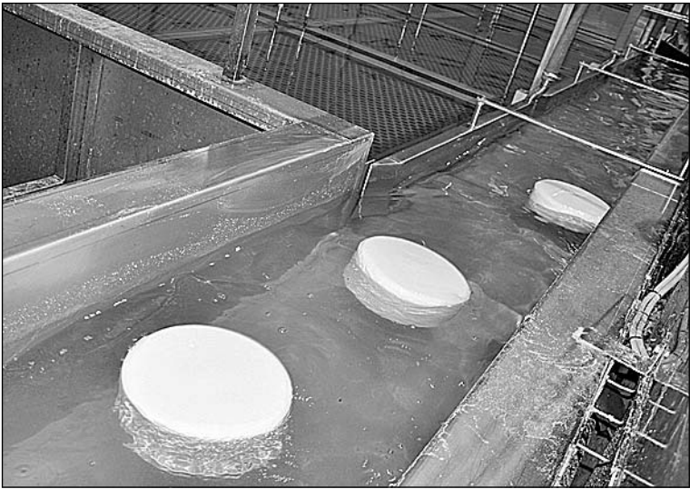
На конвейере сыры, произведённые в новом цеху.

ческого развития Белгородской области О.В. Абрамов. - Проект, как и был задуман, достойно претворён в жизнь и полностью вписывается в программу, которую мы все поддерживаем, - «Импортозамещение».