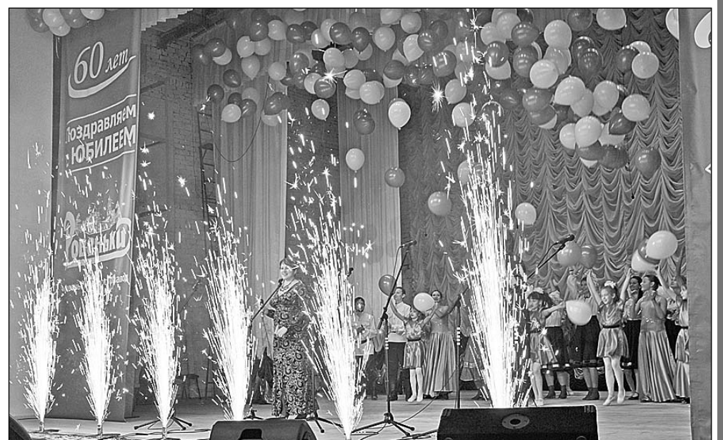
Праздничный фейерверк, завершивший торжества

- Продукция завода представлена везде, она качественная, вкусная, экологически чистая, способная заменить многие им-