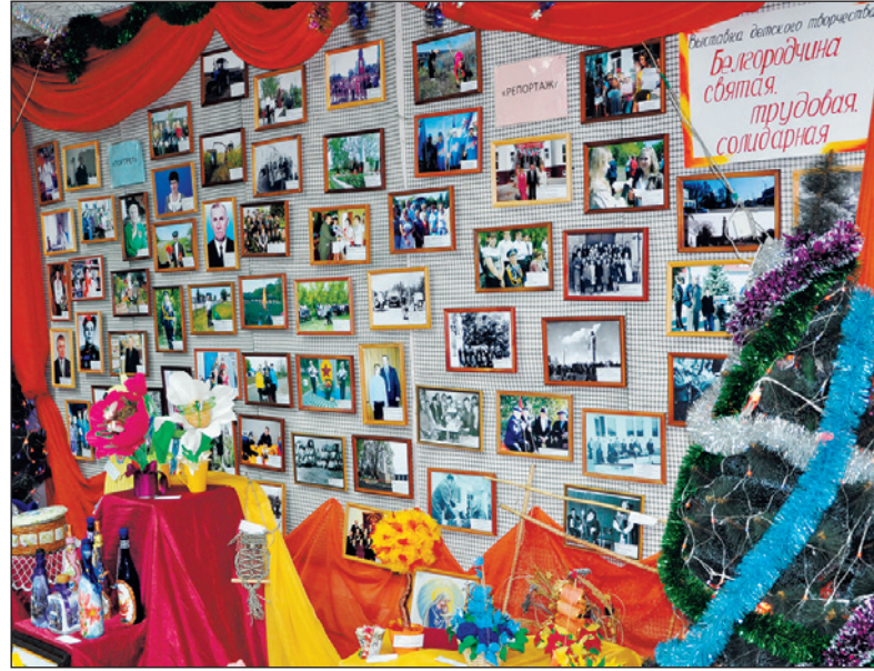
60-летию образования Белгородской области Ровеньской станцией юных техников организованы выставки детского творчества «Юные таланты Отчизны» и фотовыставка «Белгородчина святая, трудовая, солидарная». Все экспонаты представлены впервые и отличаются разнообразной техникой изготовления, высоким качеством и современным дизайном.