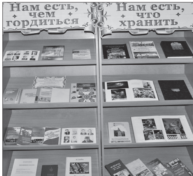
В центральной районной библиотеке экспонируется книжная выставка «Нам есть кем гордиться. Нам есть что беречь». На ней представлены книги наших знаменитых земляков, а также издания о них.

ва был закуплен набор музыкальных инструментов для него.